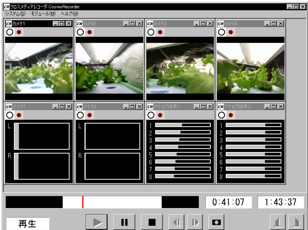
図. 「コスモレコーダー」の再生画面